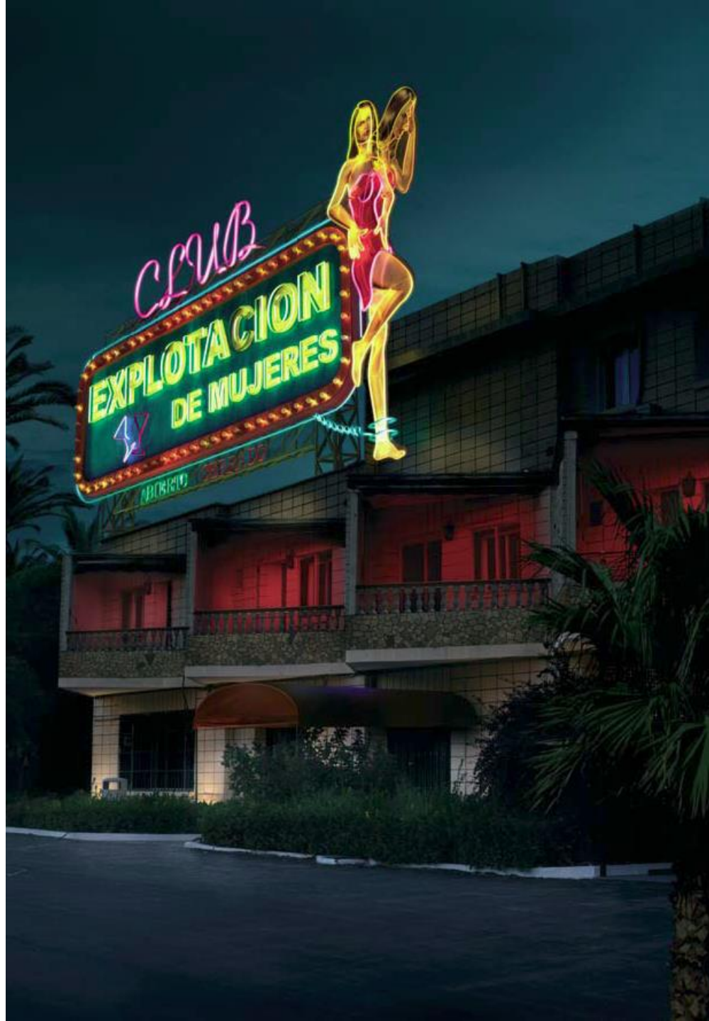
Campaña Concello de Madrid